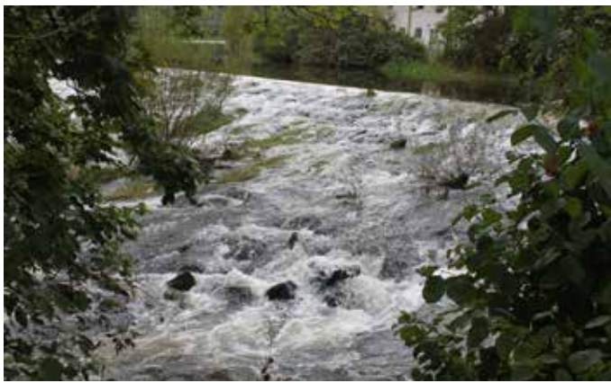
Die gut wasserführende Donau bei Immendingen in regnerisch herbstlichen Tagen.

Um sich besser über die einzigartige Donauversickerung informieren und das Naturphänomen touristisch besser zu erschließen, haben die Städte Tuttlingen und Fridingen sowie die Gemeinde Immendingen unter Federführung der Donaubergland Marketing und Tourismus GmbH gemeinsam mit dem Landkreis Tuttlingen am Donauradweg entlang der Donau