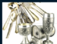
Besteck / Zinn