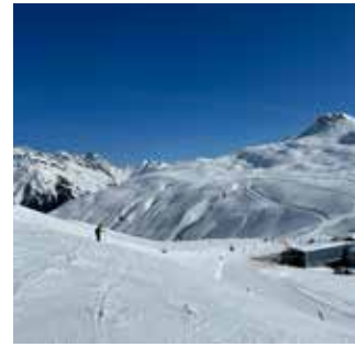
Das Skigebiet Silvretta Montafon begeistert mit bestens präparierten Pisten für Einsteiger und Köhner sowie der längsten Talabfahrt in Vorarlberg.

Schruns / Vorarlberg (mm). „Willkommen im sportlichsten Skigebiet“ steht als Slogan der international bekannten österreichischen Skiregion „Silvretta Montafon“. Die Silvretta Montafon begeistert mit Vielfalt und Herausforderung und wir nicht ohne guten Grund als sportlichstes Skigebiet bezeichnet. Mit der längsten Talabfahrt Vorarlbergs, die auf 1.700 Höhenmetern Ausdauer und Kraft erfordert, kommen ambitionierte Skifahrer voll auf ihre Kosten. Sieben Black Scorpions – Pisten mit Neigungen von bis zu 67 Prozent – sowie Rennstrecken mit Videoanalyse in der neuen Race Area runden das Pisten-Abenteuer ab. Für Freeride-Fans bietet das Skigebiet Technik- und Sicherheitskurse im Gelände sowie geführte Touren durch den Powder. Freestyler können sich im Snowpark Montafon austoben, sei es an den Rails oder bei Sprüngen in der Luft. Aber auch für Einsteiger und Familien hält Silvretta Montafon jede Menge bereit. Mehrere Skischulen geben die richtige Einführung in Technik und Sicherheit und schulen das richtige Verhalten auf und abseits der Pisten. Frühaufsteher können dreimal wöchentlich bei den Sonnenaufgangsfahrten die ersten Spuren auf den frisch präparierten Pisten ziehen und anschließend bei einem herzhaften Bergfrühstück neue Energie tanken. Das Skifahrermotto heißt: „Entdecke die Silvretta Montafon und jeden Muskel deines Körpers“. Mehr zum erlebnisreichen Skigebiet unter www.silvretta-montafon.at .